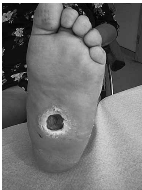
Εικ. 2. Χρόνια οστεοαρθροπάθεια Charcot στο αριστερό πόδι της ίδιας ασθενούς. Η παραμόρφωση έχει οδηγήσει σε εξέλκωση, της οποίας επιπλοκή είναι η οστεομυελίτιδα. Από το Εξωτερικό Ιατρείο Διαβητικού Ποδιού, Β' Παθολογική Κλινική, Δημοκρίτειο Πανεπιστήμιο Θράκης.

Οι κύριοι παράγοντες κινδύνου για οστεοαρθροπάθεια Charcot σε ασθενή με ΣΔ είναι οι ακόλουθοι 3,4,7,8 : 1) Μακρά διάρκεια ΣΔ, 2) Βαριά περιφερική νευροπάθεια, 3) Νευροπάθεια ΑΝΣ, 4)