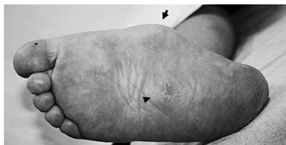
Εικ. 1. Χρόνια οστεοαρθροπάθεια Charcot στο δεξιό πόδι ασθενούς μας. Διακρίνονται η προπέτεια του έσω χείλους (βέλος) και η παραμόρφωση τύπου rocker-bottom (κεφαλή βέλους). Από το Εξωτερικό Ιατρείο Διαβητικού Ποδιού, Β' Παθολογική Κλινική, Δημοκρίτειο Πανεπιστήμιο Θράκης.

Η συχνότητα της οστεοαρθροπάθειας Charcot υπολογίζεται στο 0.8-8% με αυξητική τάση στις νεότερες μελέτες, ενώ δεν φαίνεται να υπάρχει διαφορά μεταξύ των δύο φύλων 3,4 . Η πλειονότητα των ασθενών βρίσκεται στην 5η και 6η δεκαετία της ζωής τους και το 80% περίπου έχει διάρκεια ΣΔ άνω των 10 ετών. Για λόγους που δεν έχουν διευκρινιστεί, είναι ιδιαίτερα συχνή έπειτα από μεταμόσχευση νεφρού. Κλινικώς διαπιστώνεται αμφοτερόπλευρη οστεοαρθροπάθεια Charcot σε ποσοστό 9-10% 3,4,7 . Η συχνότητα της αμφοτερόπλευρης προσβολής είναι όμως πολύ υψηλότερη (μέχρι 75%), αν η αναζήτησή της βασιστεί σε πιο ευαίσθητες μεθόδους, όπως η αξονική και η μαγνητική τομογραφία 3,4,7 . Χαρακτηριστικά, ασθενής του Εξωτερικού Ιατρείου Διαβητικού Ποδιού της Β' Παθολογικής Κλινικής του Δημοκριτείου Πανεπιστημίου Θράκης προσήλθε με χρόνια αμφοτερόπλευρη οστεοαρθροπάθεια Charcot: στο δεξιό πόδι χρονολογείται από οκταετίας (Εικ. 1) και στο α-