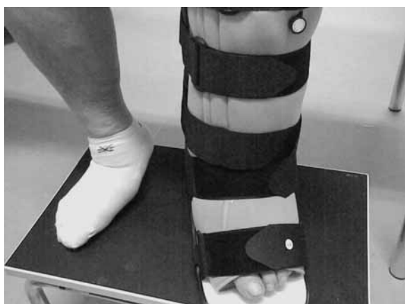
Εικ. 4. Αποφόρτιση του αριστερού ποδιού της ασθενούς με χρήση νάρθηκα τύπου Aircast. Από το Εξωτερικό Ιατρείο Διαβητικού Ποδιού, Β' Παθολογική Κλινική, Δημοκρίτειο Πανεπιστήμιο Θράκης.

την αποφόρτιση 43 . Η αποφόρτιση συνεχίζεται μέχρι τη βελτίωση της κλινικής εικόνας (ύφεση θερμοκρασίας, ακτινολογική σταθεροποίηση) 3,4,7,8,37,39,40 . Κατά μέσον όρο διαρκεί 6-8 μήνες. Παράλληλα συνιστάται και μείωση της κινητικότητας του ασθενούς. Η επανέναρξη της κινητοποίησης γίνεται πάντοτε βαθμιαία. Στη χρόνια φάση χρειάζεται αποφόρτιση και ακινητοποίηση έπειτα από χειρουργική επέμβαση 3,4,7,8,37,40 .